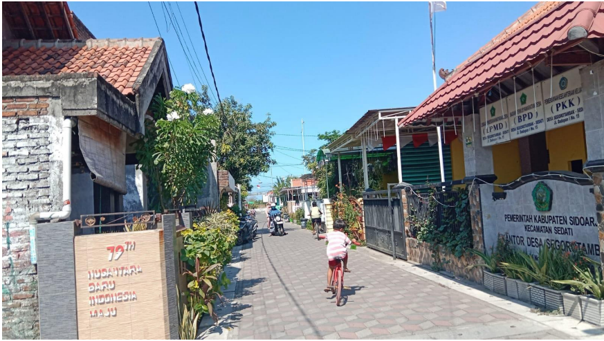
Gambar 1 Pemukiman Segoro Tambak